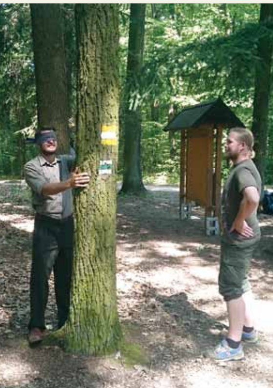
Aktivita „Poznej svůj strom“.

Skupinu rozdělíme do dvojic. Jednomu z dvojice zavážeme oči a druhý jej dovede k nějakému stromu. Ten, který má zavázané oči, si strom pořádně osahá, aby se pokusil o konkrétním stromu zjistit co nejvíc informací, jakou má kůru, tloušťku, kde má větve, jestli má kořenové náběhy apod. Následně je odveden od stromu dále, zatímco se, sundá si šátek a pokusí se najít strom, ke kterému byl předtím doveden.