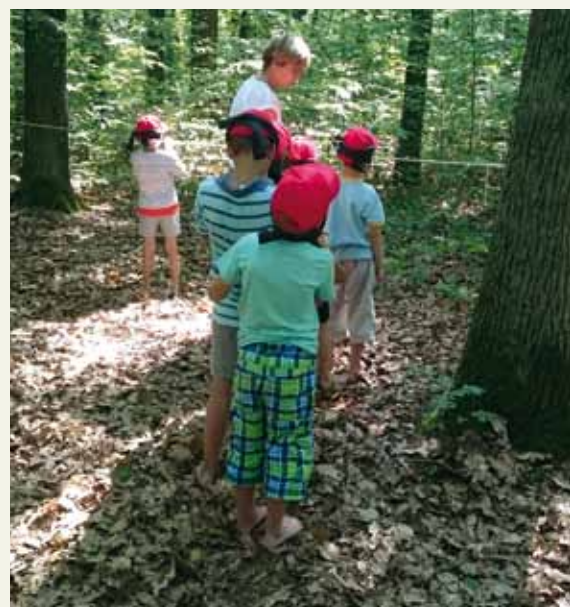
Aktivita „Krtek“.

Mezi stromy máme napnuté lano, na které pomocí kolíčků přichytíme předměty. Po jednom pouštíme děti k lanu, ty na něm hledají předměty, snaží se zapamatovat, co na laně potkaly, a dále mají za úkol najít něco k snědku.