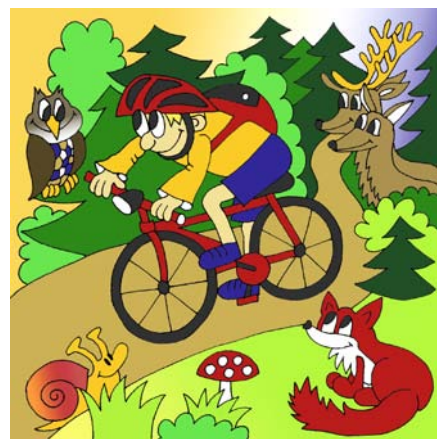
Jak se jezdí v lese - interaktivní komiks. Zdroj: www.lesnipedagogika.cz