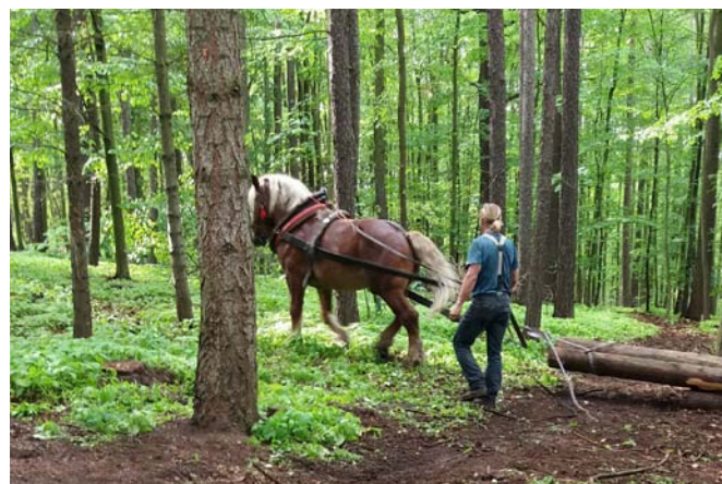
Ukázka přibližování koněm.