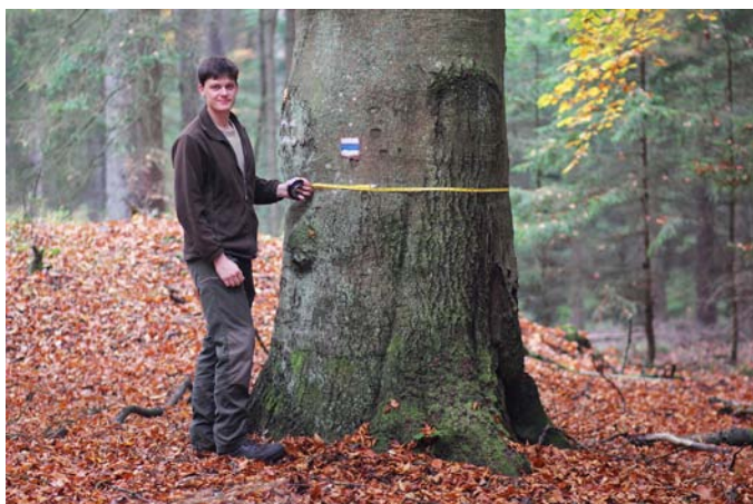
Měření obvodu kmene.

Desatero vlastníka lesa – vytvořte plakát s povinnostmi majitele lesa.