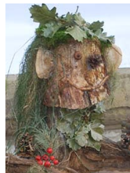
Oslavy lesa na Floře 2011

Vytvořte si z větviček, listů, šišek a různých lesních plodů lesního skřítko.